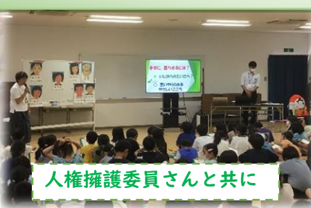
人権擁護委員さんと共に