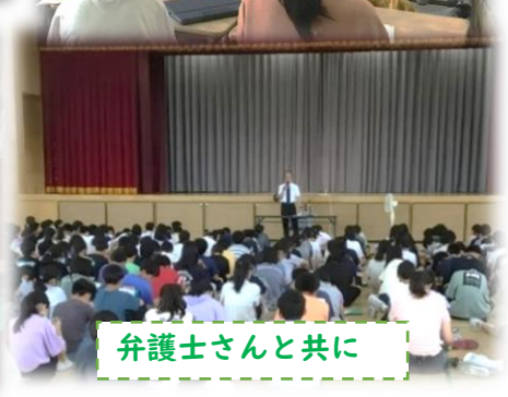
弁護士さんと共に