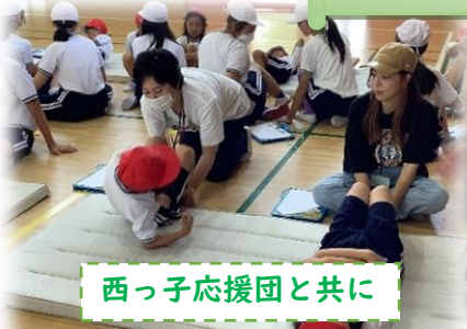
西っ子応援団と共に