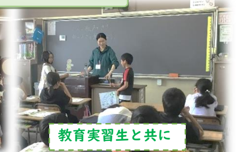
教育実習生と共に